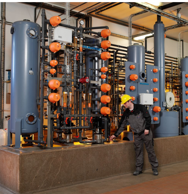
Anläggning som producerar matarvatten till högrycksångturbin.