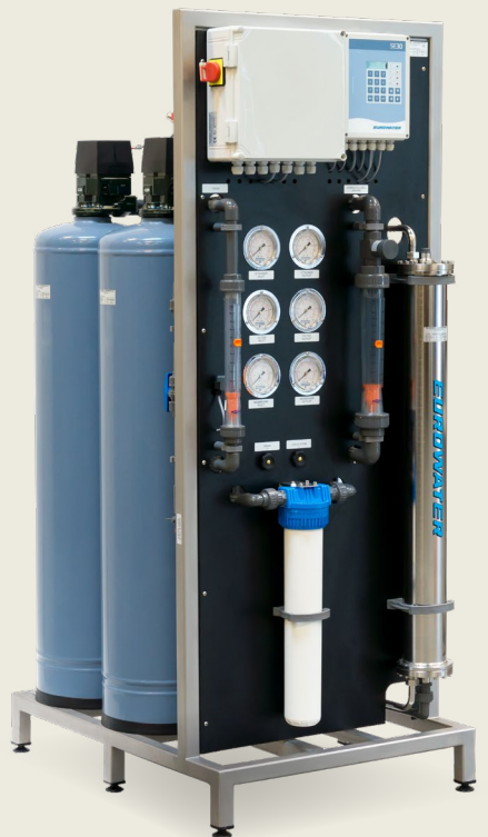
Kompakt stativmonterad CU:RO-anläggning komplett med avhärdning och omvänd osmos redo för användning.