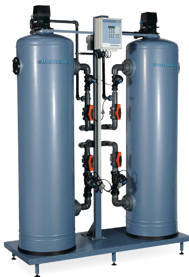
Avhårdningsanläggning typ SMP 602