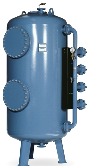
Tryckfilteranläggning typ TFB 14

Vattenbehandlingsanläggning som producerar 3 \times 25 \text{ m}^3 / \text{h} ultrarent vatten i en kemiindustri. Installationen består av tre individuella stativmonterade RO-anläggningar med vattenbesparande RO-Plus-steg följda av varsitt EDI-system.