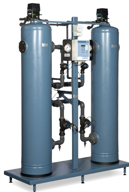
Eksempel på rammemonteret dupleks-blødgøringsanlæg i standardudgave med SE20-styring.

For at sikre optimal og sikker brug af systemet foretages programmeringen af SILHORKOs egne specialister, som også har udviklet systemet. Softwaren er fleksibel med adskillige sprogversioner og mulighed for tilpasning til fremtidige behov.